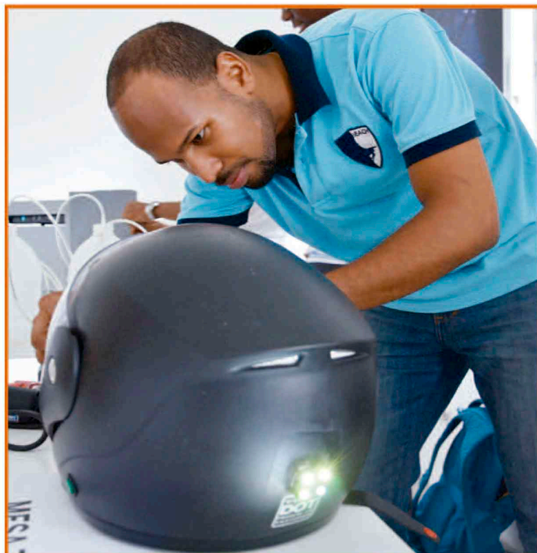
Casco inteligente para motor con aplicaciones integradas, bluetooth, cámara trasera y sistema para escuchar música.

Con iniciativas como estas les damos la oportunidad a nuestros inventores de mostrar sus grandes ideas y apostamos al desarrollo, de la mano del talento joven e innovador de nuestro país.